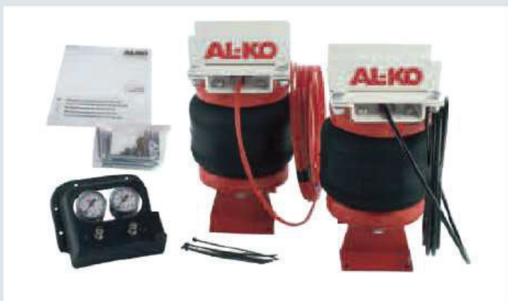
Kit AL-KO Air-Top X2-30, X2-44.