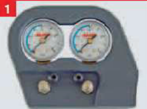
Double manomètre dans la cabine.