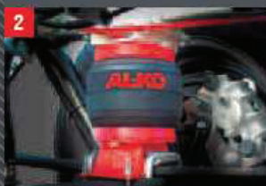
Montage sur X2/44.