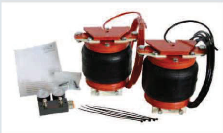
Kit AL-KO Air-Top X2-50.